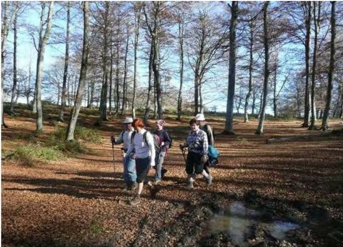
Bosque de la Sierra de Lokiz – Bajada de Otsabiz hacia Kontrasta

Esta vez, en nuestro infatigable andar, como broche final a la Semana Micológica elegimos la olvidada Sierra de Lokiz, también denominada Sierra de los Carboneros por haber sido en tiempos anteriores y hasta los años cincuenta del siglo pasado, lugar donde se trabajaba el carbón vegetal, fuente energética de la época hoy sustituido por otros tipos de energías pero que para los menos jóvenes nos haga recordar los restos de las carboneras que nosotros conocimos, entre otros sitios, en Gorbeia. Para este día estaba previsto el hacer dos tipos de excursión. Uno era el que seguidamente describiré y otro como colofón a la mencionada Semana Micológica el hacer un recorrido circular