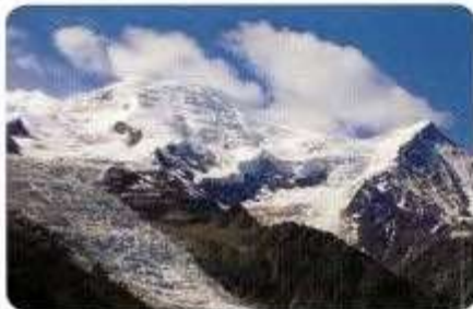
Mont Blanc (Chamonix).

ETAPA 7: REFUGIO ELENA - RELAIS DE ARPETTE. Camino de paso a Suiza por el Grand Col de Ferret de 2.537 m. Una vez en Ferret pueblo, la subida hasta Champex (importante centro turístico) se hace larga, pesada y carente de interés pues discurre por caminos paralelos a la carretera. Este tramo se puede obviar –sin prostituir en exceso el espíritu montañero de la travesía–