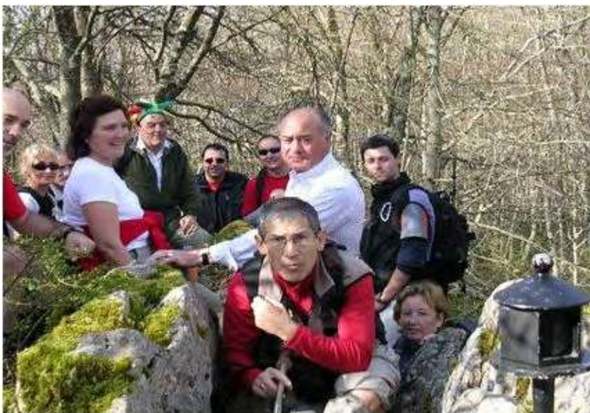
En la boscosa cima del Jaundel.

TERCERA ETAPA. En esta sigue teniendo la fisonomía de montaña, menos que