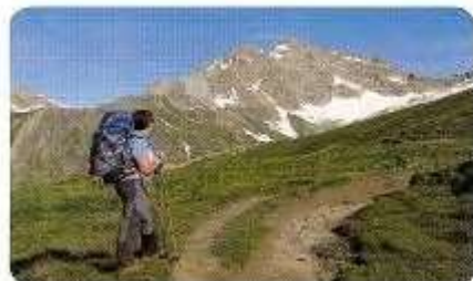
Hacia Col de Bonhomme.

en los pequeños buses de línea que recorren el valle.